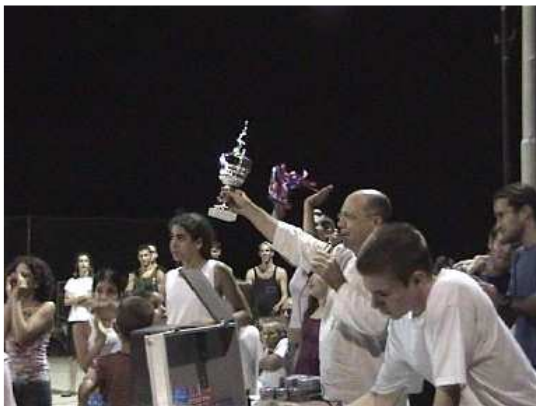
מזכיר הקיבוץ מתבלבל ומניף את הגביע