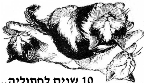
10 שנים לחתוליה...

יהודית מדר, 44 זהר קציר, 44 אמנון אטורסקי, 30 רותם אברהמי, 29 עובל שקד, 28 אמיתי הורכביץ, 21