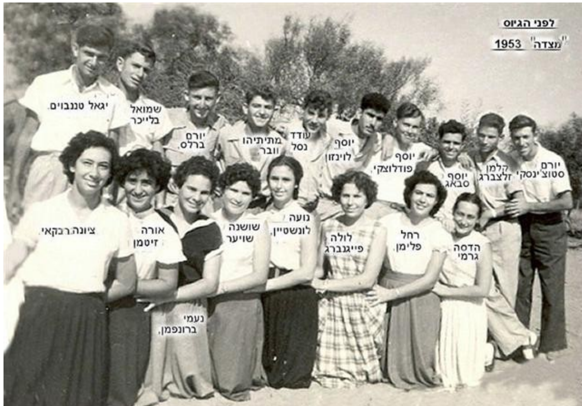
תמונה שנשלחה לאתר ע"י יורם סתיו כשעודד נפטר