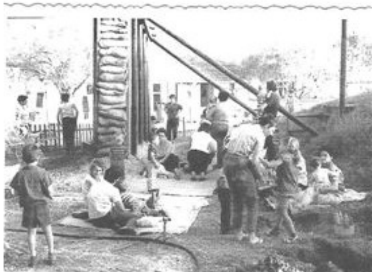
מלחמת 6 הימים, 1967