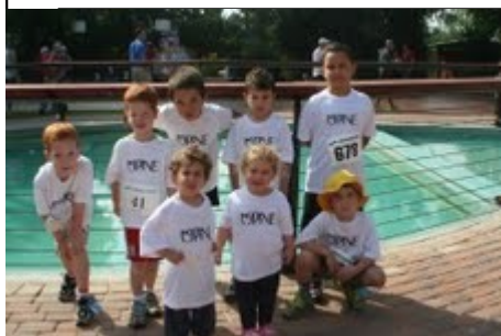
התמונות ממרוץ ברוקס ניר-אליהו 11/05/2013