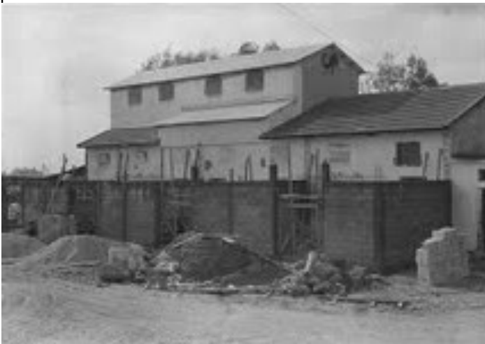
פלסטניר 1973— המבנה הראשון

בימים אלה נעשות ההכנות לקליטת אקסטרודר חדש שיגדיל הייצור ב 40%.