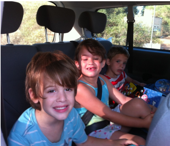
הסעה לבית הספר הדמוקרטי בכפר-סבא